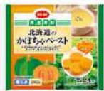
北海道のかぼちゃペースト 宅配予定 11月1回

添加物が入っていないので離乳食に重宝しています。子どももパクパク食べてくれます!