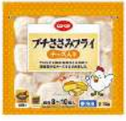
プチさみフライ 宅配予定 10月4回 店舗取扱い

大きくなって巣だった子どもたちの大好きだった商品です。帰省してきた時にこれがあると笑顔になり、思い出話に花が咲きます。商品は、高温で手早く揚げようとするので、解凍しきれないようになりやすいので、急ぐ時でも低温でゆっくり揚げるとよかったです。