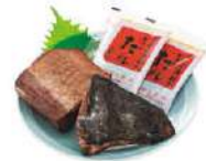
わら焼きかつおタタキ 宅配予定 10月2回

このかつおタタキは特にお気に入りです。他のモノとは全然美味しさが違います! 食べる直前に解凍し、中が少し凍っている状態で食卓に出します。