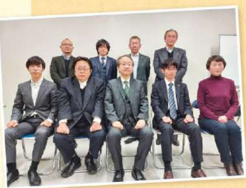
▲夜間無料法律相談会の弁護士さんと事務局

(受付時間…平日9時～17時) 開催当日の正午までにご予約ください。 相談は13名の弁護士(ボランティア)が当番制で対応します。