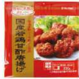
国産若鶏甘酢唐揚げ

自然解凍ができるので、レンジを使う手間もなくおすすめです。忙しい朝でも手軽にできて、家族みんな気に入ってくれているのでよく買っています。作りながらついつつまみ食いたくなります(笑)