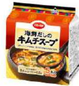
海鮮だしのキムチスープ