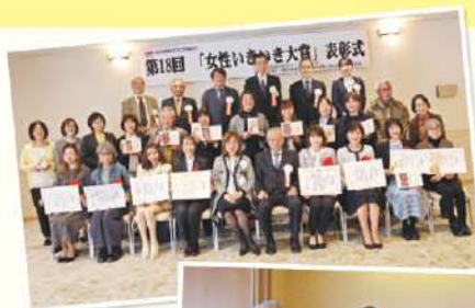
◀第18回受賞団体の皆さん

「住みよい地域社会」をめざして、ボランティア活動やコミュニティ活動・民間非営利団体(NPO)活動などに、女性が中心となってチャレンジする団体を応援しています。「くらしづくり」、「子育て」、「福祉」、「地域づくり」分野において自主的な活動を行い、創意と工夫に富んだ活動に対し表彰します。自薦はもちろん、あなたの周りでいきいきと活動に取り組まれているグループをぜひ推薦してください。