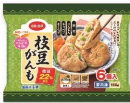
co-op 枝豆がんも 6個入