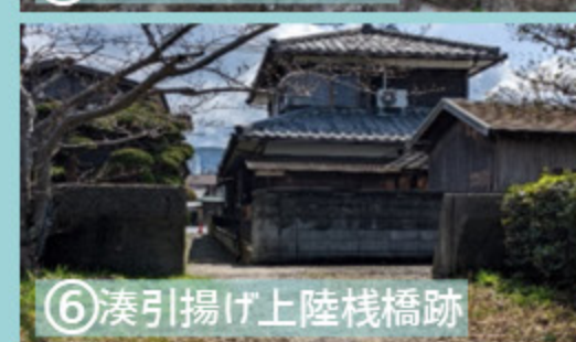
⑥ 湊引揚げ上陸棧橋跡