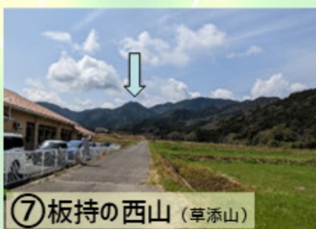
①⑦ 板持の西山 (草添山)