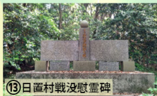
①⑬ 日置村戦没慰霊碑