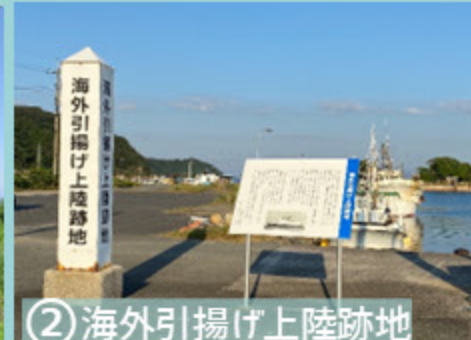
② 海外引揚げ上陸跡地