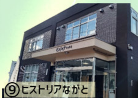
①⑨ ヒストリアながと