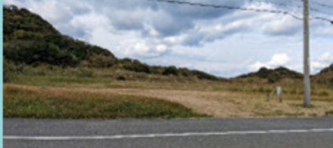
①⑦ 海軍大浦水上飛行艇 基地跡