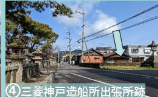
④ 三菱神戸造船所出張所跡